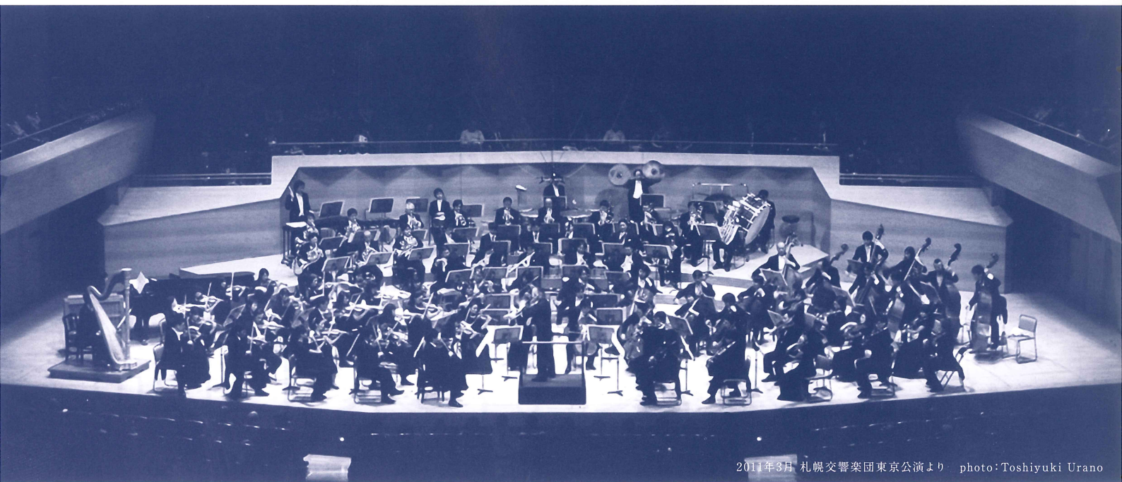
2011年3月 札幌交響楽団東京公演より

1961年発足。「札幌」の愛称で親しまれ、年間120回を超える数の公演を道内外で行っている。これまで指揮者に荒谷正雄、ペーター・シュヴァルツ、岩城宏之、秋山和慶など優れた指揮者が歴任、創立50周年の2011年現在、音楽監督に尾高忠明、正指揮者に高関健、首席客演指揮者にラドミル・エリシュカという充実した指揮者陣を数く。透明感のあるサウンドとパワフルな表現力は雄大な北海道にふさわしい魅力を放つオーケストラとして広く知られる。海外ではドイツ、アメリカ、英国、韓国、東南アジア等を訪問。11年5月に50周年記念ヨーロッパ公演としてドイツ・英国・イタリアの3カ国5都市をめぐり、各地で高い評価を得た。同年秋には尾高音楽監督の指揮で交響曲全曲の演奏会とCD収録の「ベートーヴェン・ツィクルス」に取り組み、さらに注目を集めている。