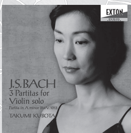
J.S.バッハ 無伴奏ヴァイオリン・ パルティータ全曲、他