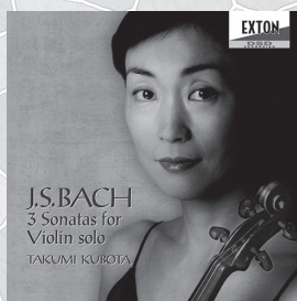
J.S.バッハ 無伴奏ヴァイオリン・ソナタ全曲

Octavia Records Inc. WEB SHOP: https://octavia-shop.com/