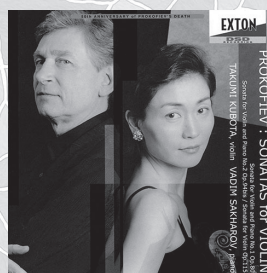
プロコフィエフ: ヴァイオリン・ソナタ全曲

ピアノ: ヴァディム・サハロフ [CD] OVCL-00099 ¥2,857(税別)