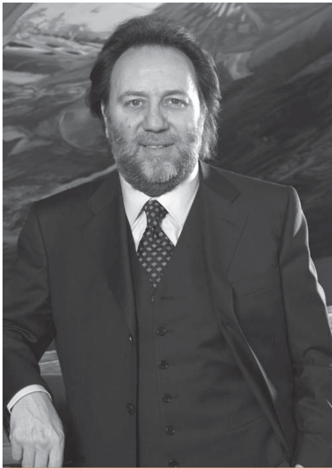
指揮: リッカルド・シャイー Gewandhauskapellmeister: Riccardo Chailly

2014年 3/21 (金・祝) 18:00 (17:30開場) サントリーホール Friday, March 21, 2014 at 6 p.m. Suntory Hall