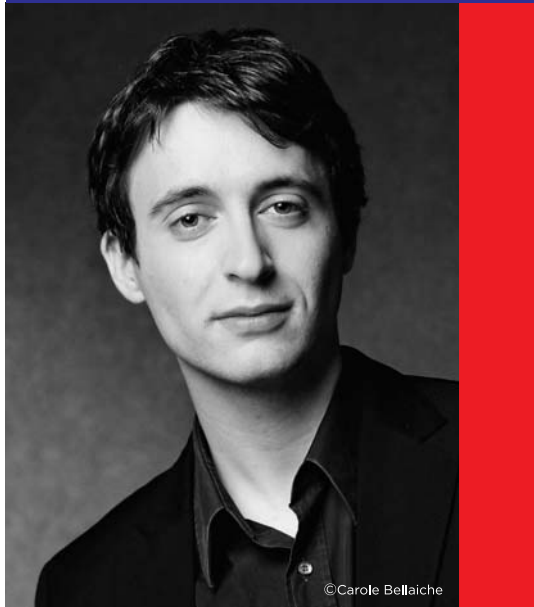
パーヴォ・ヤルヴィ (音楽監督) Paavo Järvi, Music Director