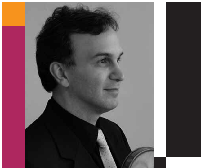
Gil Shaham, Violin