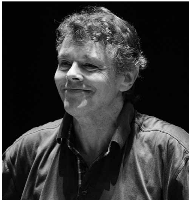
Mariss Jansons, Conductor