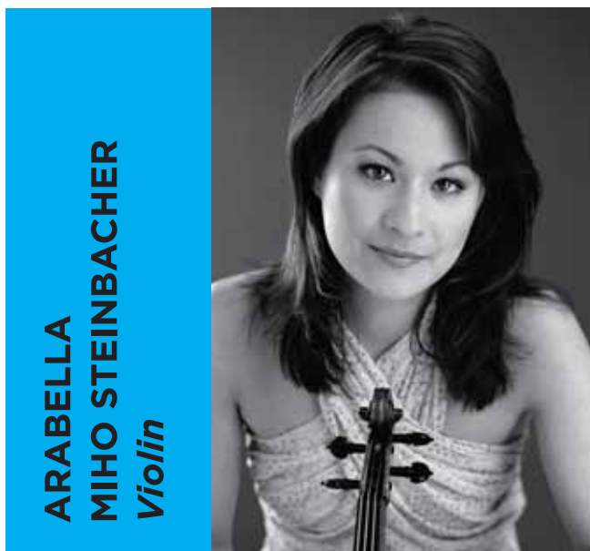
ARABELLA MIHO STEINBACHER Violin